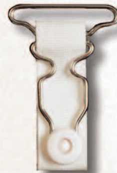
182 PKS/30 Miralloy BL genietet