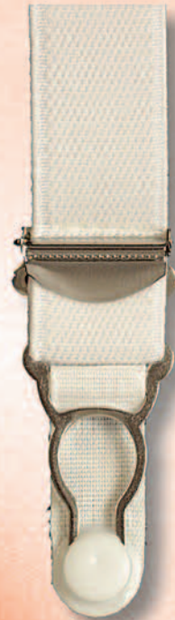
3520 V Miralloy weiß