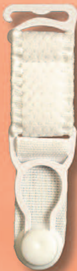
3415 A lack. weiß