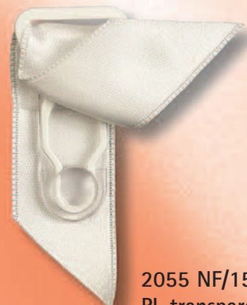
2055 NF/15 PL transparent