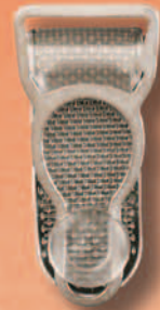
1155/15 Miralloy PL transparent