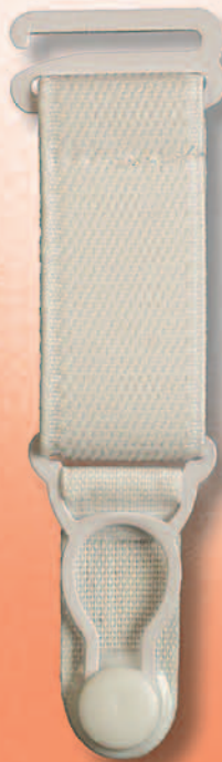
3420 A lack. weiß