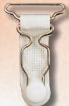
182 A/25 Miralloy BL