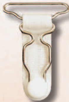
182 A/30 Miralloy BL