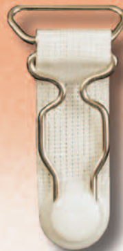
182 A/20 Miralloy BL

Silberfarbene Hochglanzveredelung (Weißbronze)