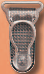
1155/20 Miralloy PL transparent