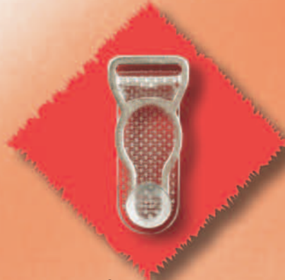
2055/12 Miralloy PL transparent