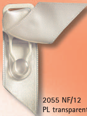
2055 NF/12 PL transparent