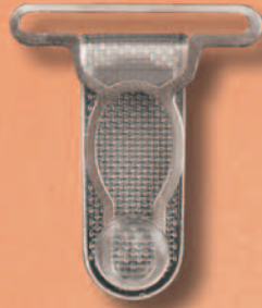
1155/30 Miralloy PL transparent

Silberfarbene Hochglanzveredelung (Weißbronze)