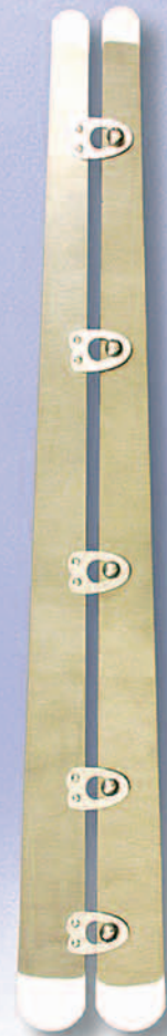
konische Nirosta-SchlieÙe 2326

Erhältlich in jeder Länge: von 14 - 20 cm 4 Verschlusssteile von 21 - 31 cm 5 Verschlusssteile von 32 - 39 cm 6 Verschlusssteile von 40 - 50 cm 7 Verschlusssteile Sonderausführungen auf Anfrage